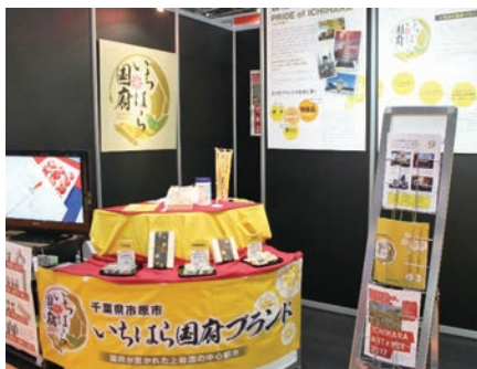
ビッグサイト内のブース