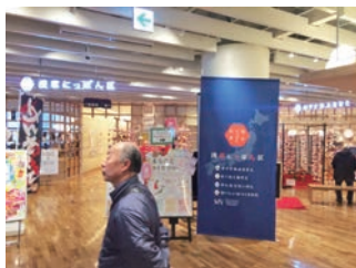
浅草「まるごとにつぼん」も視察

たり会な有しもつごプシレ全に後、々々 まに研意大見もつと「まる」ヨク国ある浅、の しな修義変学「ぽん」にまるッットセる草、の