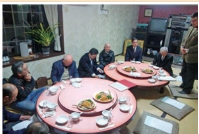
三和支部新年会 1月27日 蘭樹龍にて