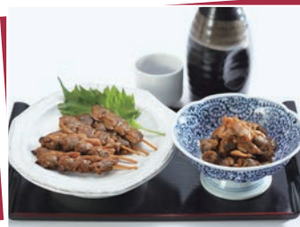
製造者：(有)時田商店 (市原市椎津161)