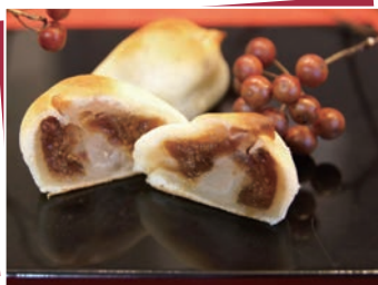
製造者：(有)姉崎松月堂 (市原市姉崎323)