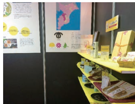
ビッグサイト内のブース

たり会な有しもつごプシレ全に後、々々 まに研意大見もつと「まる」ヨク国ある浅、の しな修義変学「ぽん」にまるッットセる草、の