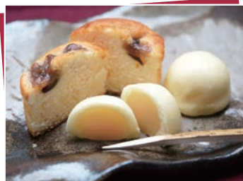
製造者：(株)松月堂本店 (市原市八幡1021)