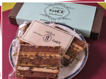
製造者：(有)ゴット (市原市姉崎485-1)