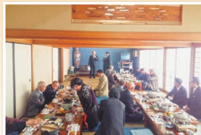
加茂支部新年会 1月24日 千鶴にて